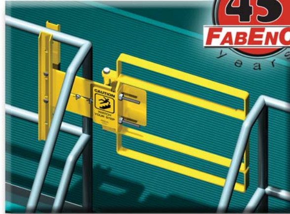
Série XL : La barrière à couverture étendue