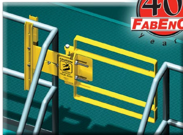
La série XL : notre barrière à couverture étendue