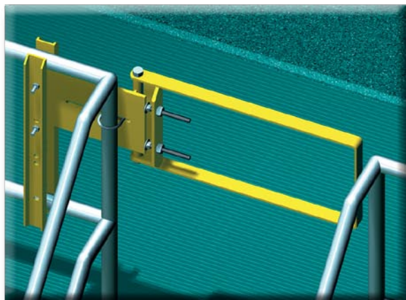
La série A-71 : le choix des sociétés de la liste Fortune 500