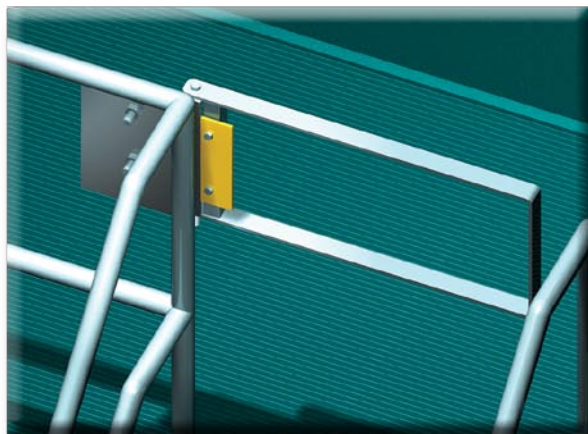
La série R : des solutions de rechange de qualité, à prix abordable, aux barrières « en plastique »